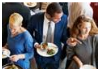
VERGADERINGEN & BIJENKOMSTEN