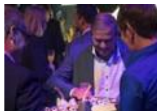
BEDRIJFSFEESTEN & PERSONEELSFEESTEN