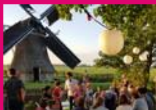
CATERING THUIS OF OP LOCATIE