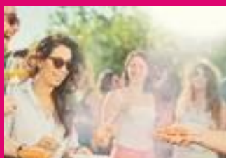
OUTDOOR COOKING FESTIVAL