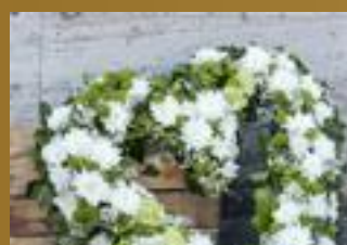
BEGRAFENIS OF CREMATIE